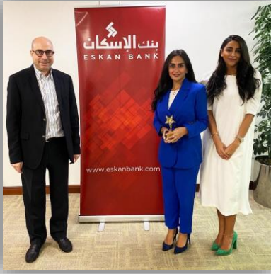
سبا داوود العباسي