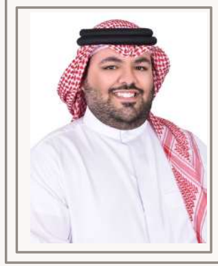
الشيخ حمد آل خليفة مدير أول إدارة المؤسسات المالية والبرامج الحكومية